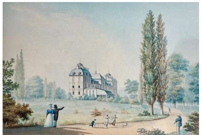
Le théâtre érigé perpendiculairement à la façade sud